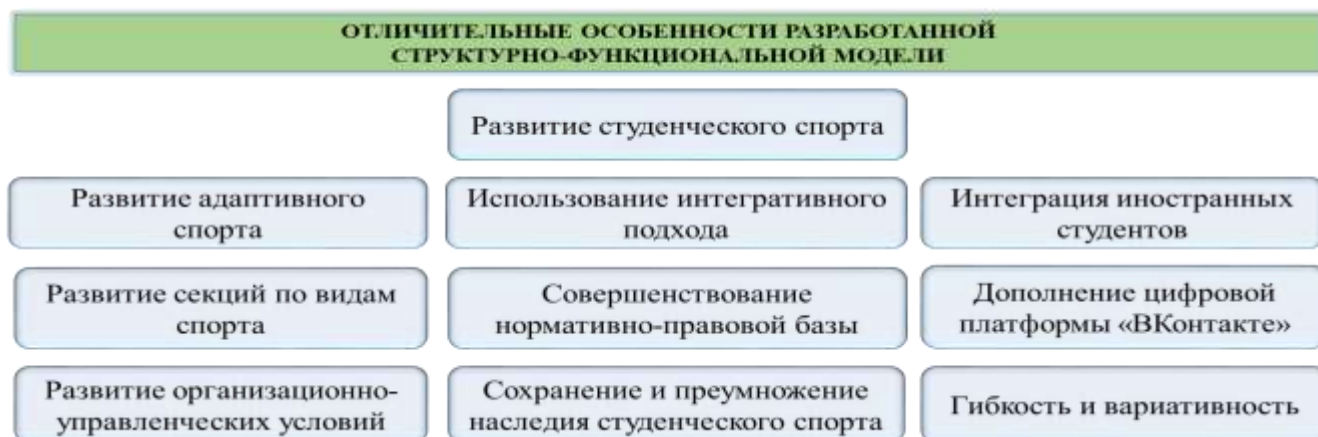
Рисунок 4 – Особенности разработанной структурно-функциональной модели управления развитием студенческого спорта в вузе на основе интегративного подхода

организационно-управленческого потенциала. Отличие применяемых подходов в развитии физкультурно-спортивной работы в ЭВ и КВ заключалось в использовании структурно-функциональной модели управления, отличительные особенности которой представлены на рисунке 4.