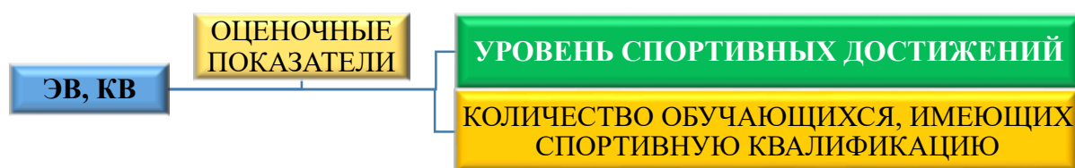
Рисунок 2 – Оценочные показатели развития студенческого спорта в ЭВ и КВ после проведенного эксперимента

На основании проведенного анализа нормативно-правовой базы, механизмов работы экспериментального вуза (далее – ЭВ) и контрольного вуза (далее – КВ), с учётом практического и теоретического опыта, были сформированы количественные и качественные показатели, которые отражали эффективность развития студенческого спорта (рисунок 2).