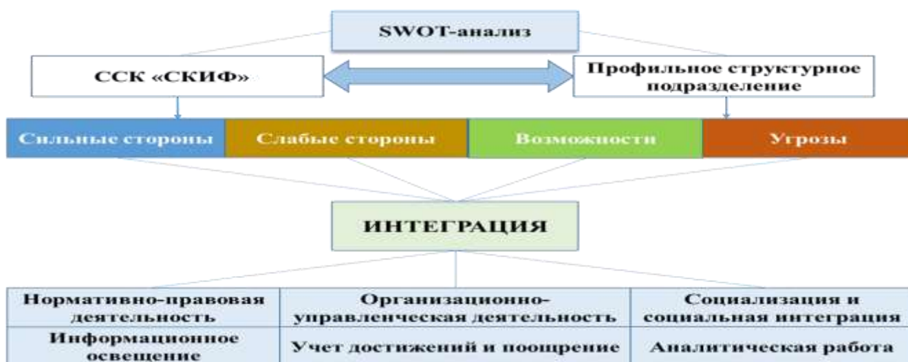
Рисунок 3 – SWOT-анализ интегративной деятельности студенческого спортивного клуба и ОСМР

Неотъемлемой и значимой частью исследования является проведение SWOT-анализа на предварительном этапе, который позволил оценить текущую ситуацию и выявить направления интегративного взаимодействия студенческого спортивного клуба и профильного структурного подразделения в вузе (рисунок 3).