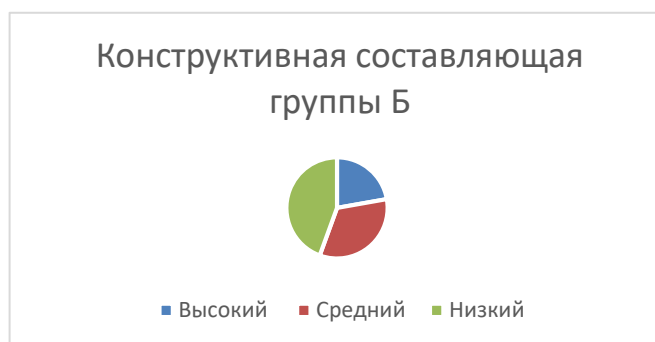
Рисунок 2. Конструктивная составляющая в двух группах

Как видно на Рисунке 2, в группе А (студентов-музыкантов) зафиксирован высокий уровень конструктивной составляющей, в отличие от группы Б, что обусловлено их профессиональной подготовкой и привычной дисциплиной музыкального обучения.