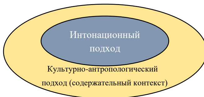
Рисунок 1 – Соотношение основных подходов к исследованию и обучению Ёнхи

моделированию педагогических условий адекватного освоения корейского традиционного искусства в единстве и органичности его антропопрактики (Рисунок 1).