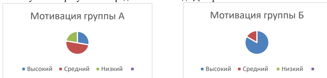
Рисунок 1. Мотивационная составляющая в двух группах

Полученные результаты представлены в виде Диаграмм.