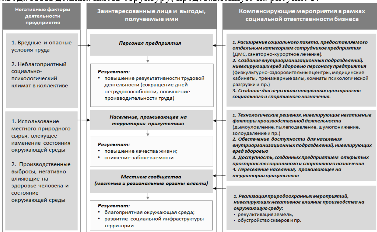
Рис. 5. Модель корпоративной системы здоровьесбережения Барнаульского завода АТИ

корпоративного уровня системы здоровьесбережения является распространение ее действия на всех лиц, угрозу здоровью которых несет производственная деятельность промышленного предприятия. Исходя из вышеизложенного следует, что корпоративная система здоровьесбережения деятельности Барнаульского завода АТИ должна иметь структуру, представленную на рисунке 5.