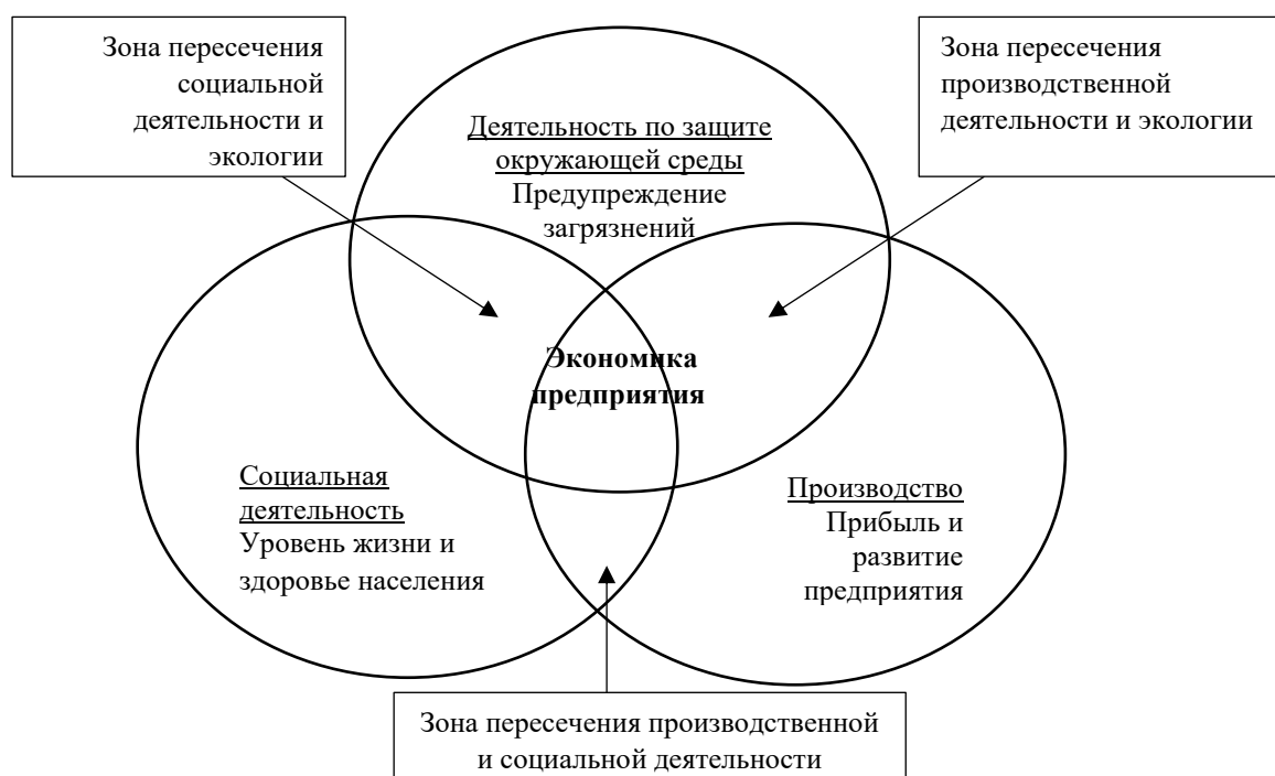
Рис. 1. Схема устойчивого развития экономики промышленного предприятия, выраженная посредством трех компонент его деятельности (экономической, социальной, экологической)

1. Дополнены представления об устойчивом развитии экономики промышленного предприятия в контексте его социальной политики. С позиций обеспечения устойчивого развития экономики промышленного предприятия в контексте социальной политики деятельность предприятия предусматривает не только потребление и использование ресурсов (материальных, природных, человеческих), но и предотвращение и нивелирование ущерба работникам предприятия и населению, проживающему на территории его присутствия, а также распределение ренты от деятельности промышленного предприятия между его стейкхолдерами. На этой основе конкретизированы направления социальной деятельности промышленного предприятия (рис. 1).