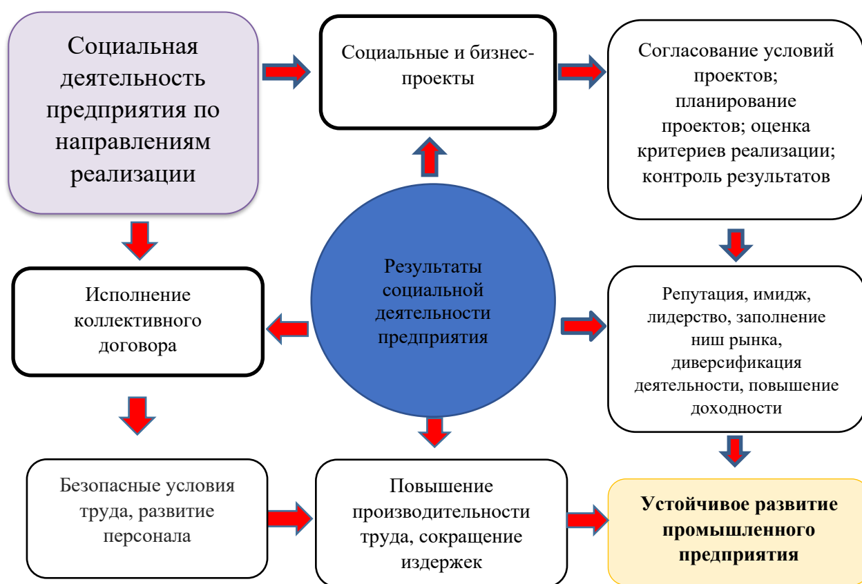
Рис. 2. Теоретическая модель устойчивого развития экономики промышленного предприятия в контексте его социальной деятельности

Во-вторых, предусматривать реализацию собственных социальных проектов или финансовое участие в социальных проектах, инициированных экономическими агентами (в том числе финансово поддерживаемых государством). С позиций устойчивого развития экономики промышленного предприятия разработка и реализация социальных проектов – это реальная возможность для промышленного предприятия решить не только отдельные социальные проблемы работников предприятия и местных сообществ, но обеспечить собственное развитие на основе диверсификации деятельности и увеличения доходов.