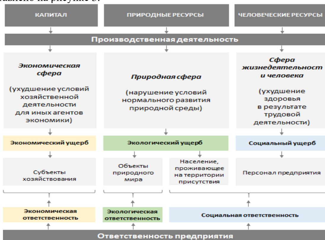
Рис. 3. Место социальной ответственности в деятельности промышленного предприятия

2. Конкретизировано содержание социальной политики промышленного предприятия с позиций обеспечения устойчивого развития его экономики. С указанной позиции развития экономики промышленного предприятия его социальная политика основана на социальной ответственности. Авторское представление о социальной ответственности промышленного предприятия представлено на рисунке 3.